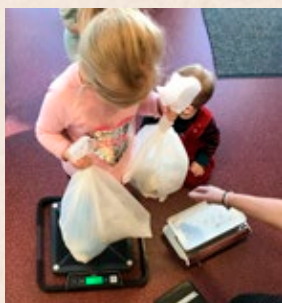
Barn på Röinge förskola väger blöjpåsar

V i vill gärna vara med och bidra till ett mer hållbart Hässleholm. Ett nytt projekt vi testat under våren är Resurssmart förskola. Röinge förskola i Hässleholm ställde snällt upp som pilotförskola och har under tre månader arbetat för att minska sitt avfall med hjälp av Sopsamlarmonstren. Vi har stått för hjälpmedel och guidning. Och visst har det gett resultat. Under veckorna lyckades de minska sitt matsvinn och sitt brännbara avfall med ca 8 %. Efter sommaren hoppas vi att fler förskolor vill bli resurssmarta. Kontakta oss för mer info.