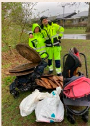
Vi hittade alltifrån gamla tidningar och kläder till barnvagnar, elkablar och söndrig moped.

I maj gick Hässleholms skräpplockarvecka av stapeln och självklart var vi på Hässleholm Miljö med som bolag. Vi plockade skräp i Ljungdala, Magle våtmark och runt Finjasjön under en regnig tisdag. Men inte fick vi ihop mindre skräp för det – hela 300 kg skräp hittades av våra fantastiska medarbetare!