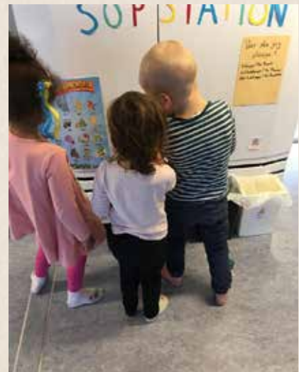
Kompostina och resten av Sopsamlarmonstren lär barnen om sortering och återvinning.